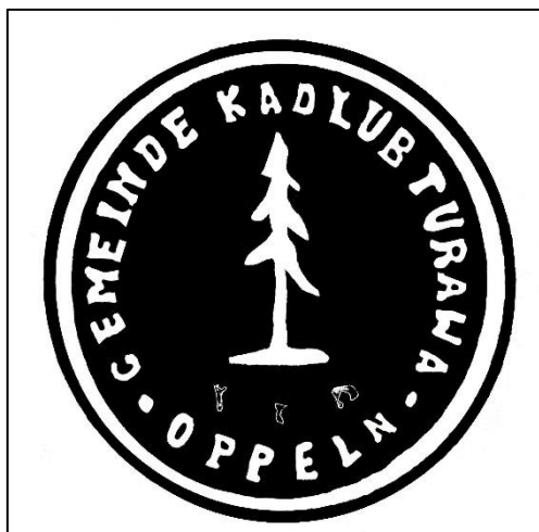
Pieczęć wsi Kadłub Turawski (po obróbce graficznej)

Pierwsza informacja o miejscowości pochodzi z 1295 r. w dokumencie biskupa Jana III z Wrocławia z 17.11.1295 r., otoczył on wtedy Kadłub Turawski opieką duszpasterską. W kolejnym dokumencie z 1375 r. dotyczącym sprzedaży mostu na Błotnicy w Gosławicach wymienione są miejscowości wokół tego mostu i ich dochody. Wśród wymienionych wsi jest m.in. Lanka, Kadłub – Calub, Kotorze, Węgry.