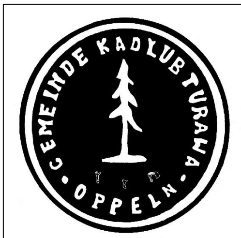
Pieczęć wsi Kadłub Turawski (po obróbce graficznej)

Pierwsza informacja o miejscowości pochodzi z 1295 r. w dokumencie biskupa Jana III z Wrocławia z 17.11.1295 r., otoczył on wtedy Kadłub Turawski opieką duszpasterską. W kolejnym dokumencie z 1375 r. dotyczącym sprzedaży mostu na Błotnicy w Gosławicach wymienione są miejscowości wokół tego mostu i ich dochody. Wśród wymienionych wsi jest m.in. Lanka, Kadłub – Calub, Kotorze, Węgry.